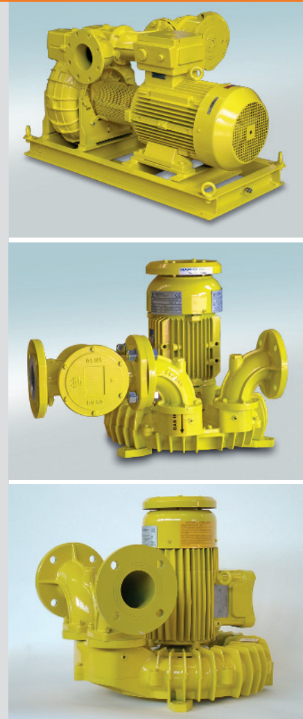
Version 03/2016 August Storm GmbH & Co. KG